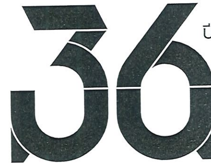
Secondary Logo – Flat Color Thai Version